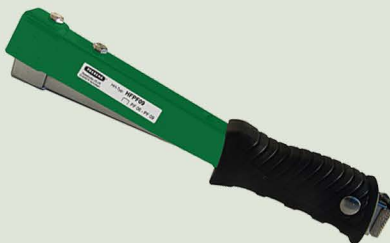
Hefthammer HFPP09 HFUPF09 HFPP14