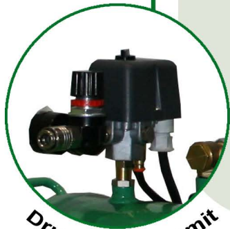
Druckminderer mit Schnellkupplung